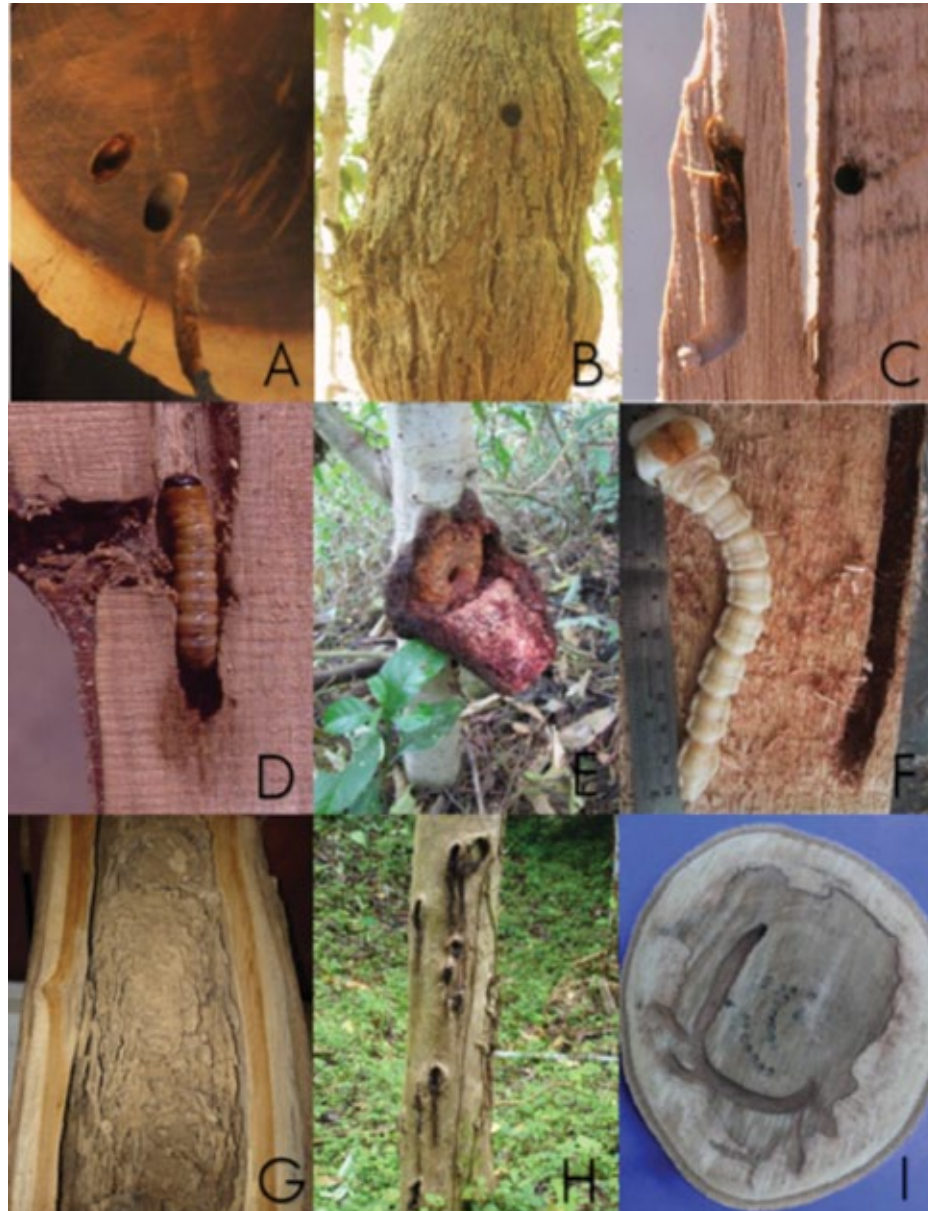
A. Brasiliatus mexicanus en Astronium graveolens ; Plagiohammus spenipennis ; B. Neodytus caciús ; C. Tectona grandis ; D. Aeptytus sp. en Gmelina arborea ; E. Phassus triangularis en Fraxinus uhdei ; F. Euchroma gigantea en Bombacopsis quinata ; G. Coptotermes testaceus en Gmelina arborea y Tectona grandis ; H. Cossula sp. en especies de Terminalia ; I. Pantophthalmus sp. en Hieronyma alchorneoides .

testaceus Linnaeus (Rhinotermitidae Family), in Gmelina arborea and Tectona grandis ; as well, the wood borer fly, Pantophthalmus sp. (Pantophthalmidae Family), in Hieronyma alchorneoides Allemão, recorded in 2014 (Arguedas et al., 2015) (Figure 2).