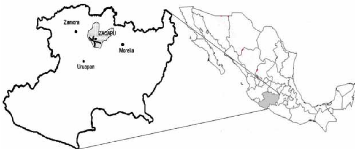
Figura 1. Ubicación de las rutas de muestreo de Pinus leiophylla en el suroeste de la Cuenca del río Angulo, Michoacán (área sombreada a la izquierda).

In January 2009, ten cones were collected from the 48 mature trees with a 300 m minimum distance among them, following four representative routes of their natural distribution at the Zacapu region of Michoacan state (Figure 1). P. leiophylla 's density in the stands is scarce and trees have not been affected by the extraction of resin.