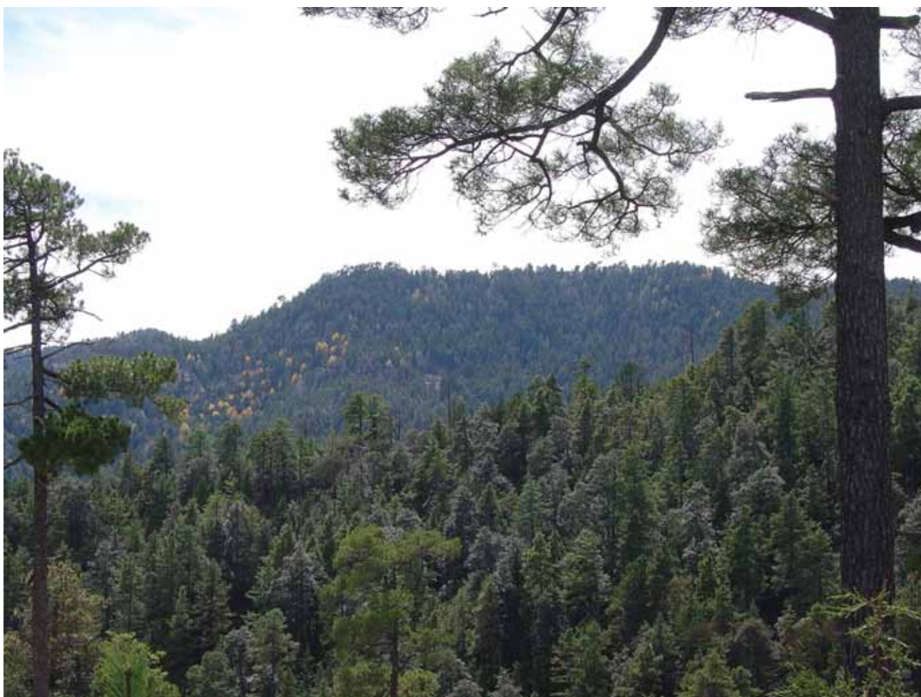
Bosque mezclado de pino-encino en el corazón de la Sierra Madre Occidental en el municipio de Santiago Papatzi, Durango. Juan Bautista Rentería Ánima (2004)