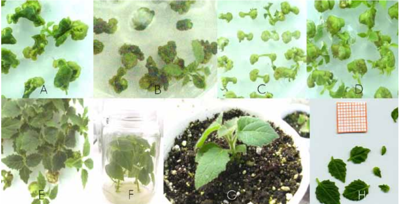
Figura 1. Regeneración de brotes de Paulownia elongata a partir de diferentes tipos de explantes. (A) = Segmentos foliares; (B) = Segmentos de hoja y-petíolo; (C) = Segmentos de petíolo; (D) = Segmentos internodales de tallo; (E) = Brotes desarrollados; (F) = Brotes en medio de enraizamiento; (G) = Plantas adaptadas; (H) = Hojas disectadas y escaneadas para medición de área foliar por análisis de imágenes.

The kind of container that is used may be involved in these responses, as indicated by experiences with different tropical micropropagated species, in which it is proved the possible interaction between the type of container and the development of seedlings: in those of small space, there is more intense