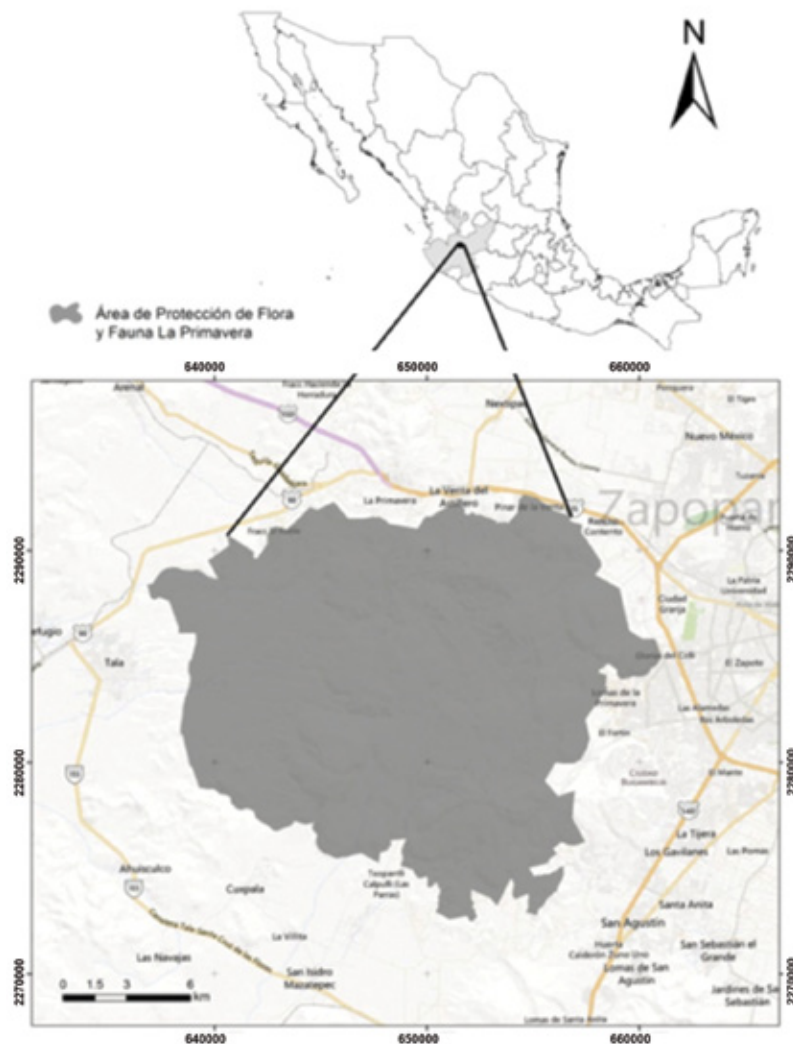
Figura 1. Ubicación geográfica del APFFLP en Jalisco, México. Figure 1. Geographic location of APFFLP in Jalisco, Mexico.

La vegetación se caracteriza principalmente por bosque de encino, bosque de encino-pino, bosque de pino, bosque tropical caducifolio, así como pastizal inducido (Semarnat, 2000).