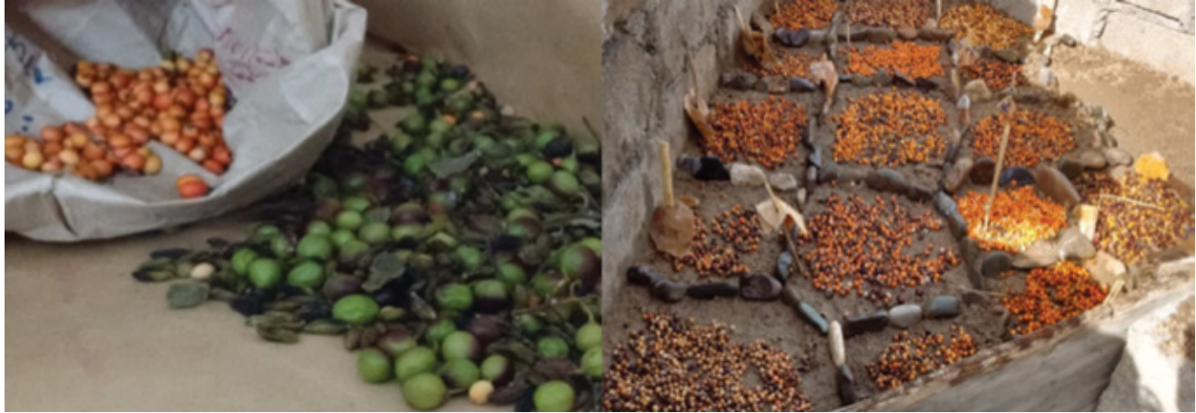
Figura 1. Semillas extraídas de frutos de Bursera heliae Rzed. & Calderón. Figure 1. Seeds extracted from fruits of Bursera heliae Rzed. & Calderón.

Las semillas recolectadas de los árboles 10 y 7 registraron diámetros ecuatoriales promedios de 0.54 y 0.544 cm, significativamente (Tukey, 0.05) mayores a los 0.448 cm de diámetro ecuatorial de las obtenidas de los árboles 3 y 24. Asimismo, las de los árboles 5 y 7 presentaron coeficientes de forma de 0.953 a 0.957, casi esféricas; mientras que las semillas provenientes de los individuos 11 y 24 fueron 0.779 a 0.760, más alargadas (Cuadro 4).