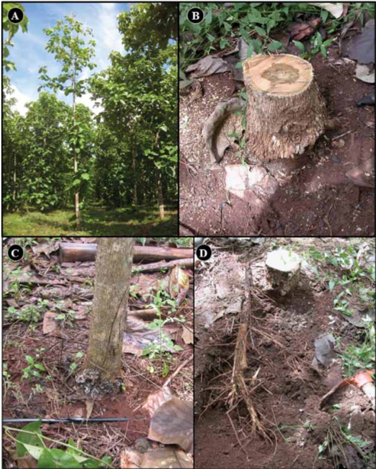
A) Árbol asintomático de teca con poco follaje y de color verde amarillento; B) Tejido calloso (hipertrofia) alrededor de la base del tronco; C) Estromas de color negro sobre la corteza; D) Raíz con pudrición. A) Asymptomatic teak tree with sparse, yellow-green foliage; B) Callous tissue (hypertrophy) around the stem base; C) Black stromata on the bark; D) Root rot.

Figura 1. Plantación comercial de Tectona grandis L. f. infectada por Kretzschmaria zonata Lév. P.M.D. Martin.