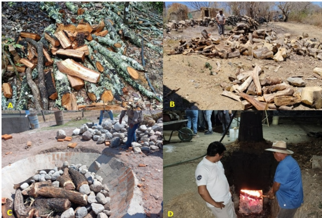
A y B = Leña verde de encino y seca de distintas especies en Temalac; C = Preparación del horno con leña de tepeguaje y rocas en Temalac; D = Destilación en El Calvario.

se valora por la liberación lenta de vapor, necesaria para el horneado de los tallos de agave; desde la termodinámica forestal esta práctica implica una severa pérdida de eficiencia. Gran parte de la energía liberada en la combustión se consume en el calor latente de evaporación del agua contenida en la madera fresca, ello reduce el valor calorífico neto y duplica la cantidad de biomasa requerida, en comparación con el uso de madera seca (Barrientos-Rivera et al. , 2020). Asimismo, la combustión incompleta de leña verde incrementa la emisión de partículas suspendidas y compuestos orgánicos volátiles, que afecta la huella de carbono del mezcal artesanal.