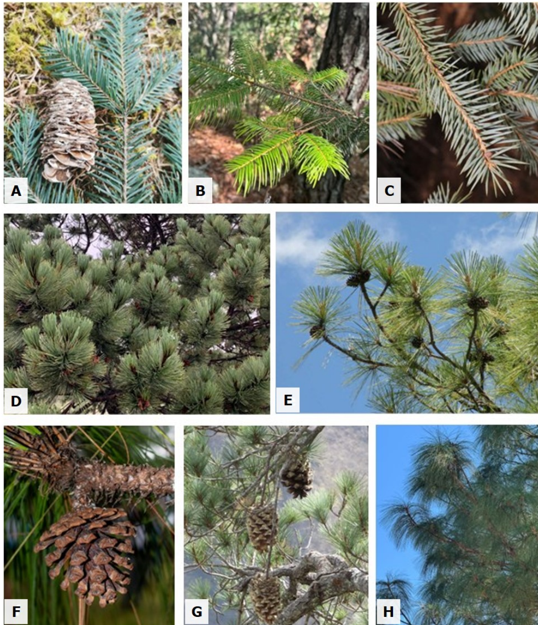
Ramillas de: A = Abies durangensis ; B = A. neodurangensis ; C = Picea chihuahuana. Detalle de forma de las hojas de: D = Pinus cooperi (rígidas y curvadas); E = P. arizonica (rectas). F = P. gordoniana var. sinaloensis ; G = P. maximartinezii ; H = P. yecorensis.