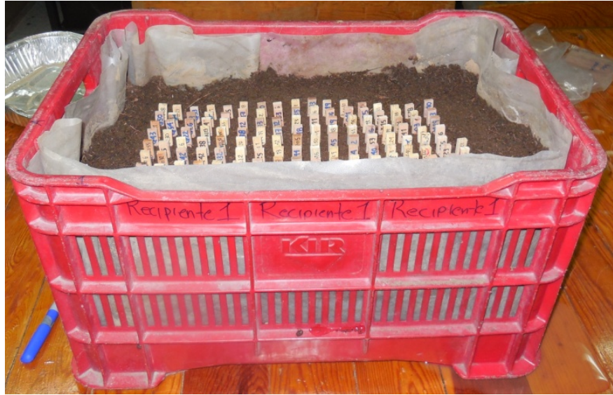
Figura 1. Probetas expuestas a microcosmos terrestre.