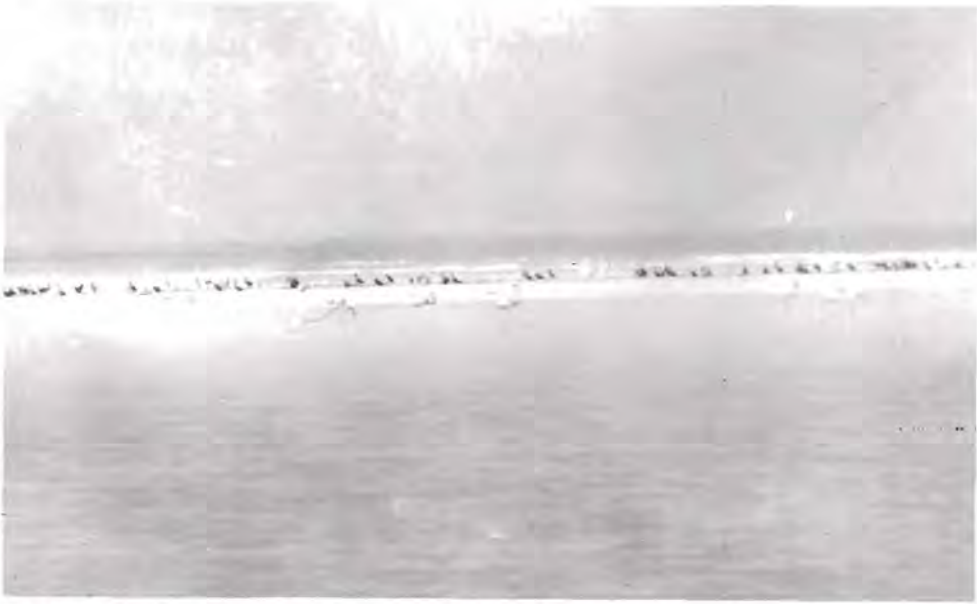
Figura 4. Las aves más grandes que se aprecian al fondo en el centro son pelicanos blancos ( Pelecanus erythrorhynchos ). Junto a ellos se ve un grupo de cormoranes marinos ( Phalacrocorax auritus ). En primer plano aparece un grupo de flamencos ( Phoenicopterus ruber ). Isla Holbox, noviembre de 1985.