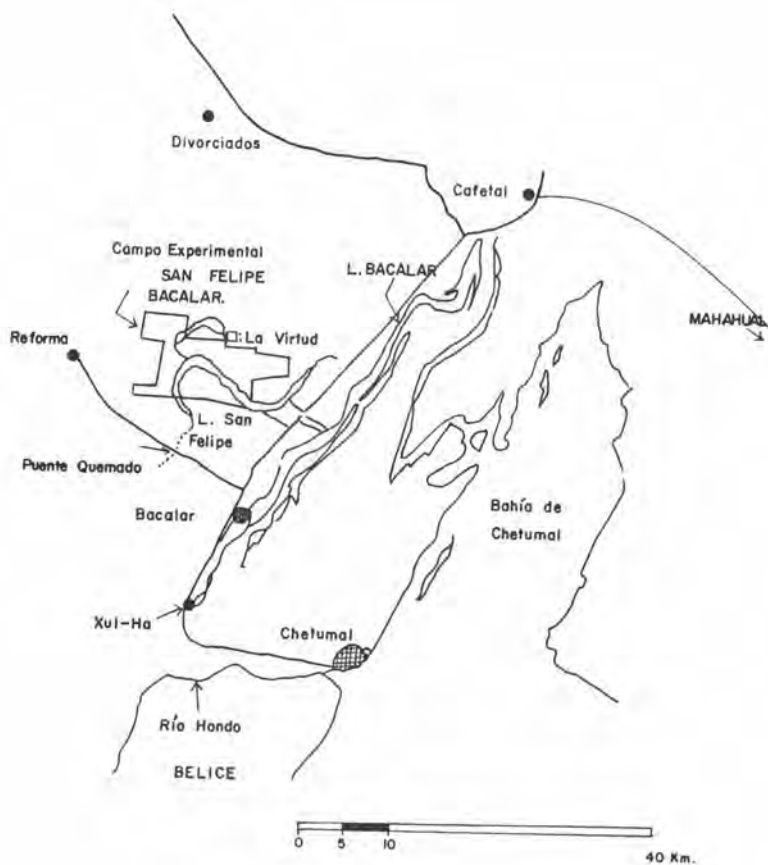
Figura 3. Campo Experimental "San Felipe Bacalar" y alrededores.