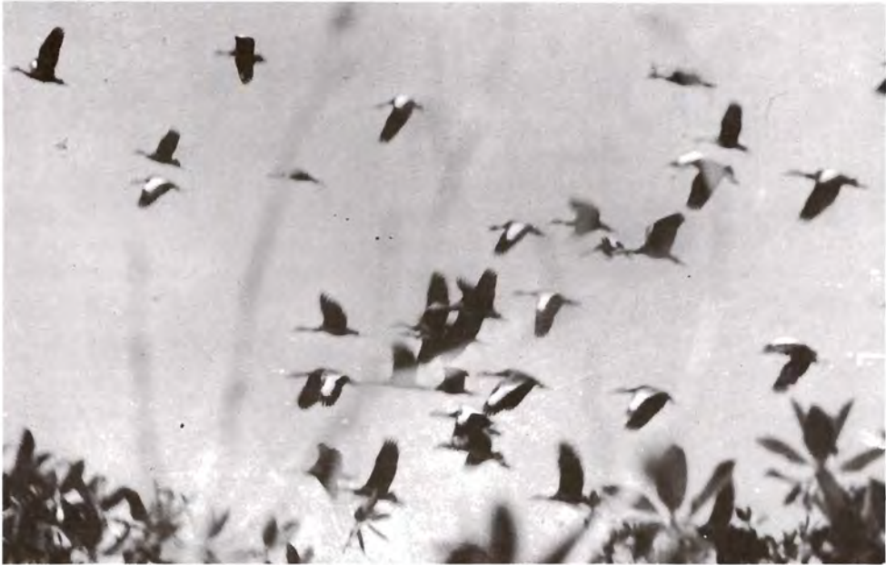
Figura 6. Pijijes (Dendrocygna autumnalia).