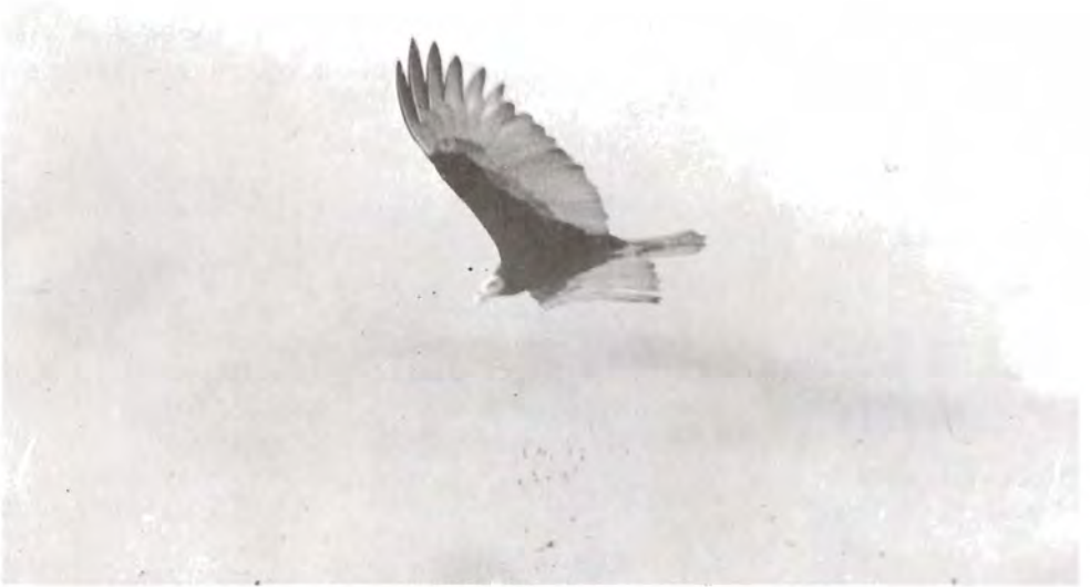
Figura 9. Aura cabeza amarilla ( Cathartes burrovianus ), en Mahahual.