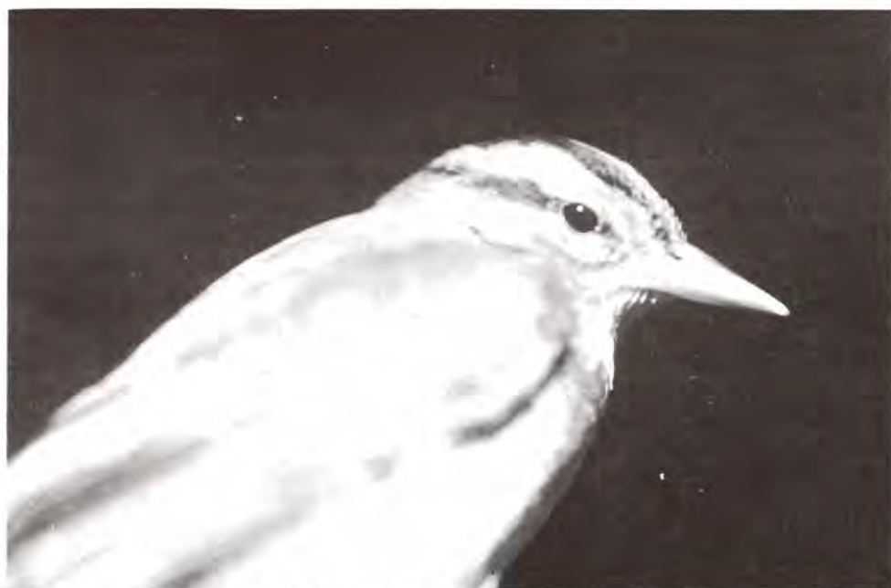
Figura 13. Pulgonero ( Helmitheros vermivorus ) ave migratoria.