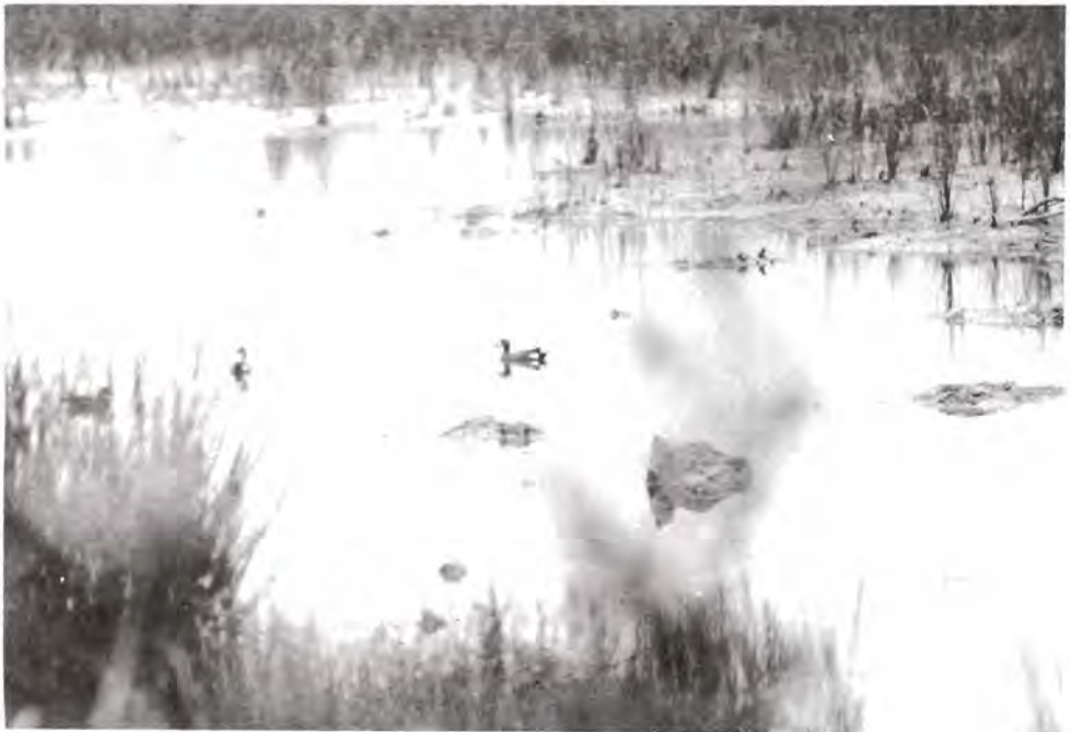
Figura 7A. Cerceta de alas azules ( Anas discors )

Maya: Sac tzem. Español: Pato golondrino. Inglés: Northern Pintail. Migratorio. Localidad: km 15 carretera Cafetal-Mahahual. Hábitat: Ciénagas.