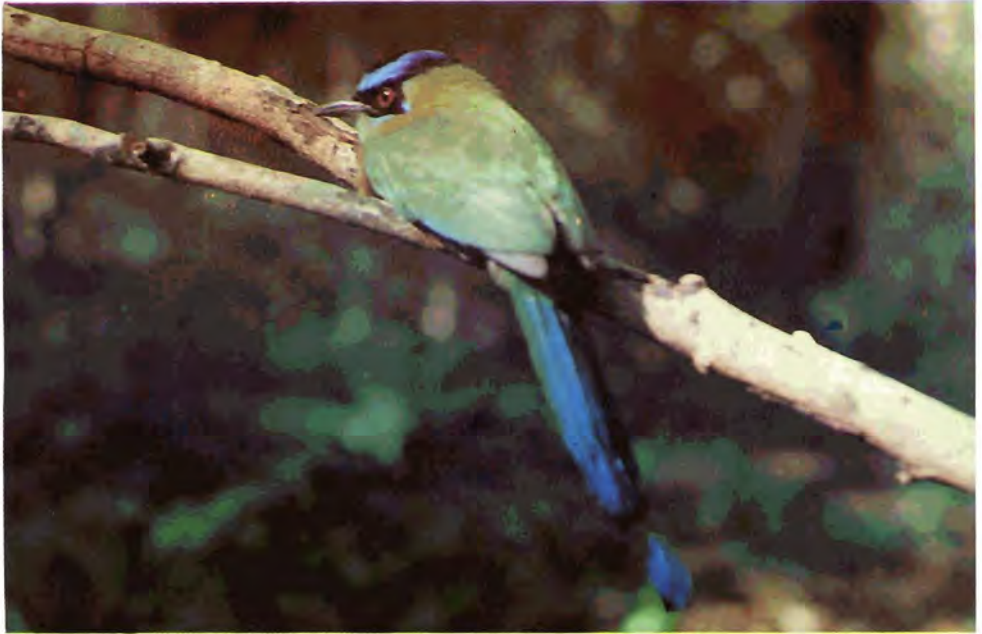
Figura 11. Péndulo de corona ( Momotus momota ).