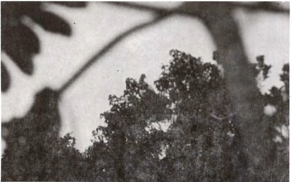
Figura 10. Zopilote rey ( Sarcoramphus papa ).