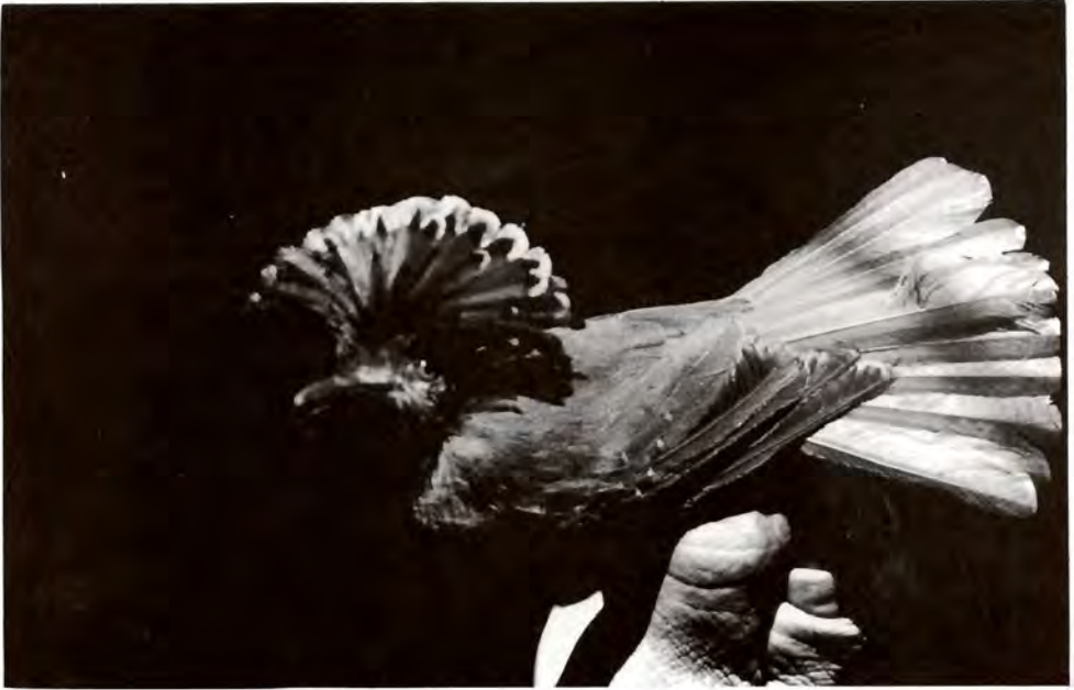
Figura 12. Mosquero real ( Onychorhynchus coronatus ).