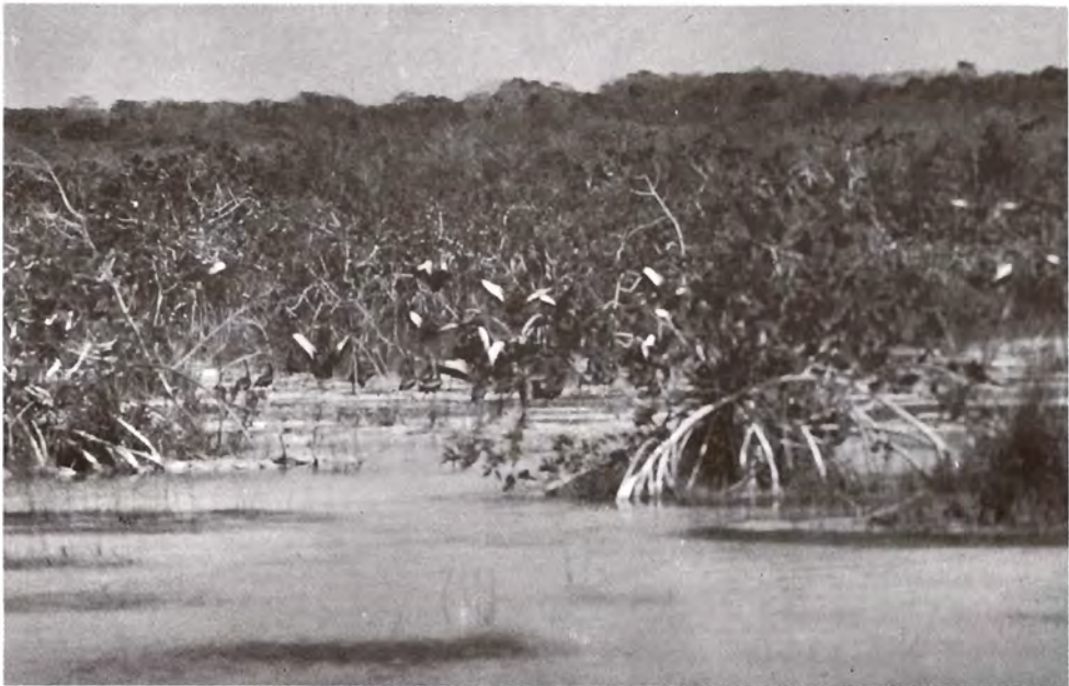
Figura 7. Pijijes (Dendrocygna autumnalia), en un manglar de la laguna de Bacalar, cerca de Xul-Hu