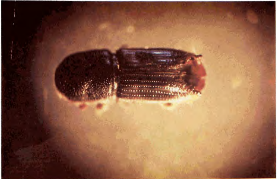
Figura 2. Adulto de Ips Integer

hospederos como ocurre en P. jeffreyi y P. ponderosa (Figura 3), hasta la eliminación completa de los árboles, esto último cuando se asocia con otros descortezadores principalmente I. pini . El primer síntoma de ataque son la aparición de pequeños grumos de resina con un polvo ligero alrededor de estos, posteriormente, el ataque se evidencia por la coloración amarillenta que adquiere el follaje de la parte atacada del árbol.