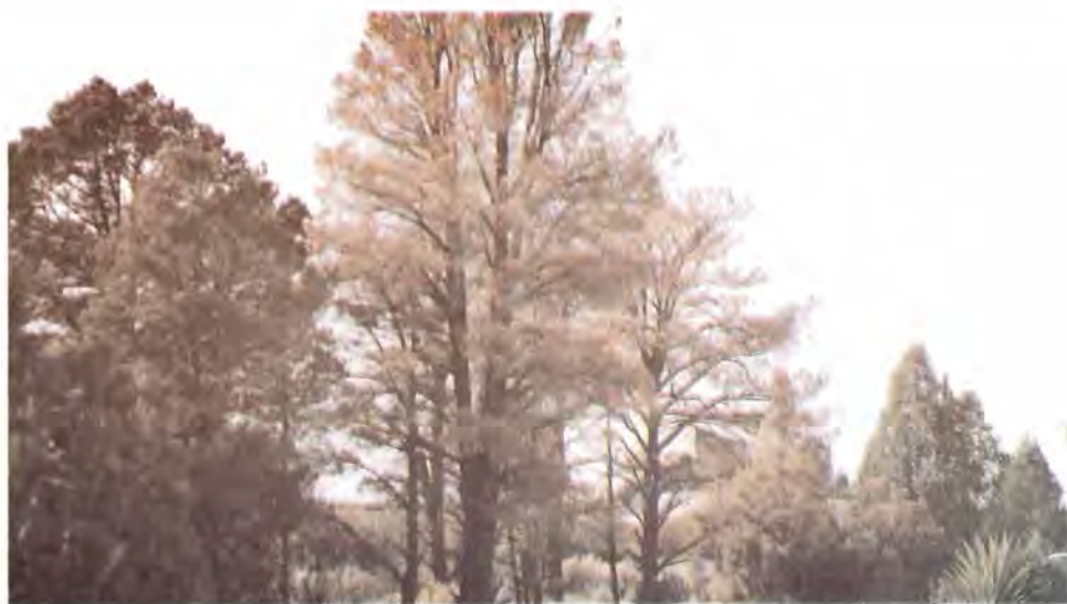
Figura 14. Grupo de árboles de P. quadrifolia muertos por el ataque de D. valens .

par es más pequeño que el primero y tiene una hilera de pequeños ganchos (hamuli) sobre su margen anterior, por medio de los cuales se adhiere al primero. Las partes bucales son de tipo masticador.