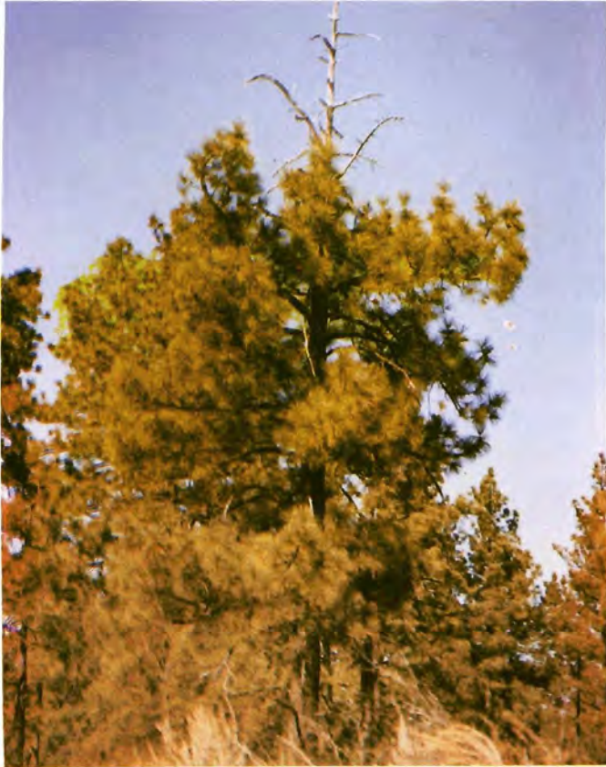
Figura 5. Individuo de P. jeffreyi con la porción muerta efecto del ataque de I. integer e I. pini .

leve (Figura 6). La larva es de color blanco, con cabeza café claro y en forma de C, con una longitud de 3 mm. La pupa es de color oscuro cuando está próxima la emergencia del adulto.