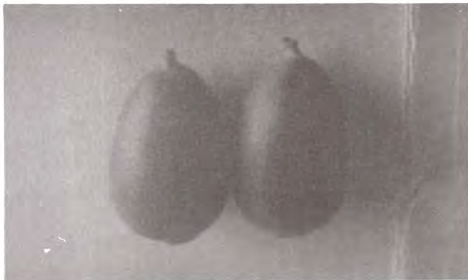
Figura 10. Bellotas de encino mostrando la perforación de salida de la larva de Curculio occidentis .

Familia Buprestidae. Esta familia de escarabajos atacan árboles y plantas leñosas, atacando preferentemente a plantas con disturbios reportado por Furniss y Carolin en 1977 y Bland en 1978. Los adultos son aplanados con colores metálicos, siendo los más comunes el verde y el negro, con antenas aserradas de 11 segmentos, su larva es alargada, con la parte anterior aplanada y la cabeza pequeña, son ápodas y por lo general de color blanco.