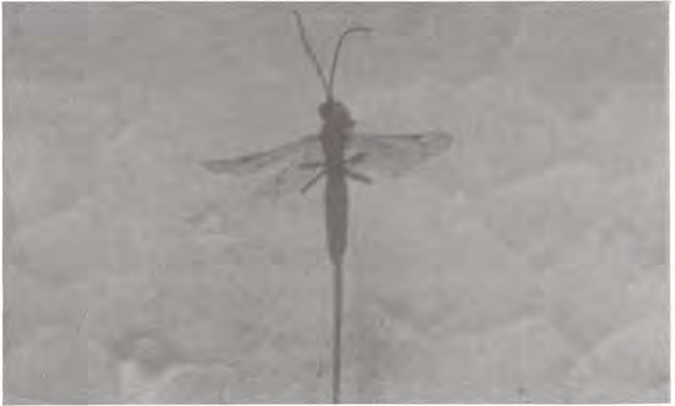
Figura 15. Adulto de Megastigmus albifrons .