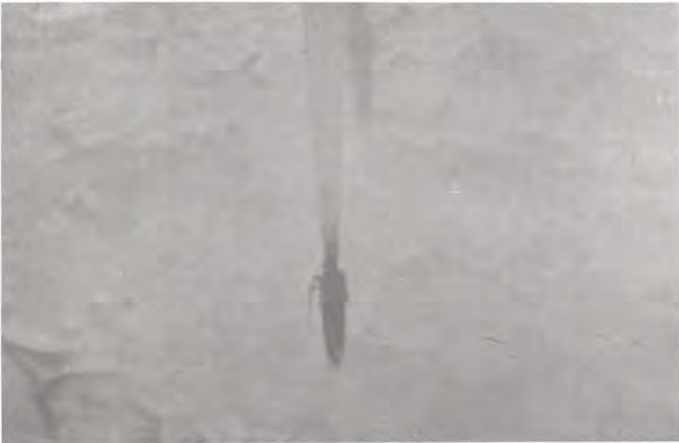
Figura 16. Palomilla de Coleotechnites milleri .

El ataque es exclusivamente a hojas, el insecto actúa como minador (Figura 17). Los primeros instares larvales son observados desde julio a enero, es decir inverna como