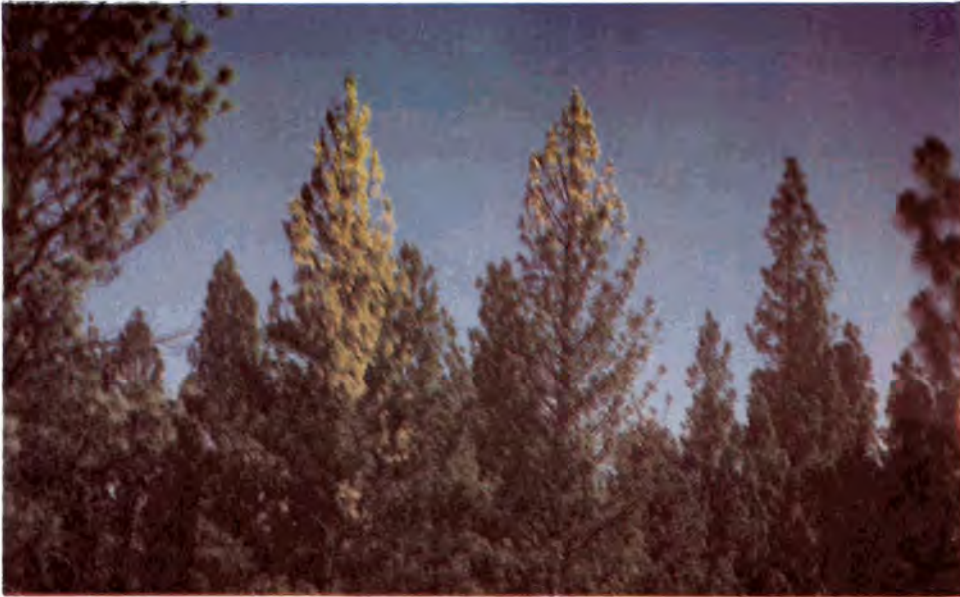
Figura 3. Árboles de P. jeffreyi afectados por Ips integer e I. pini en su tercio superior.

por las hembras son de forma aserrada; a lo largo de esta son puestos en promedio 56 huevecillos por hembra. Los cuales eclosionan en aproximadamente cuatro a seis días durante el verano y de 9 a 12 días en la primavera y otoño. En los meses de julio y agosto la larva madura en un lapso de 25 a 30 días, para pupar en la corteza; los adultos emergen en los meses indicados en un término de 8 a 10 días, haciendo perforaciones en la corteza y atacando árboles contiguos. Se presentan más de dos generaciones por año.