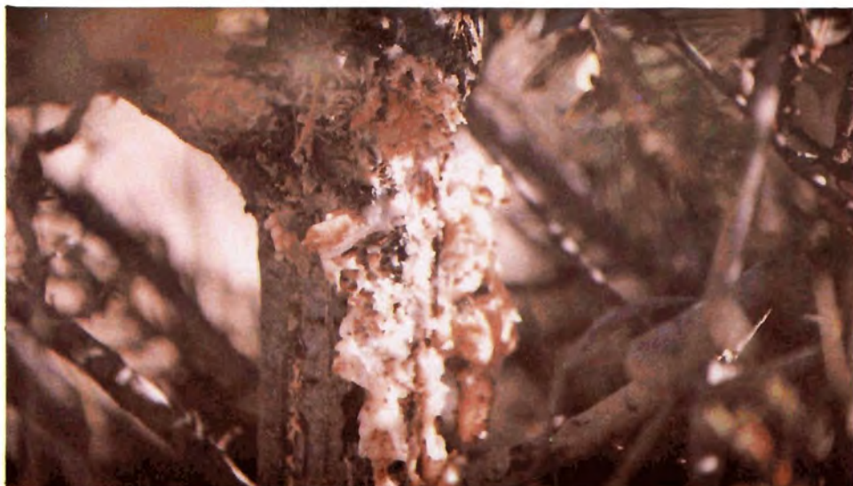
Figura 25. Galería y grumo de resina de V. sequoiae en Pinus cembroides .