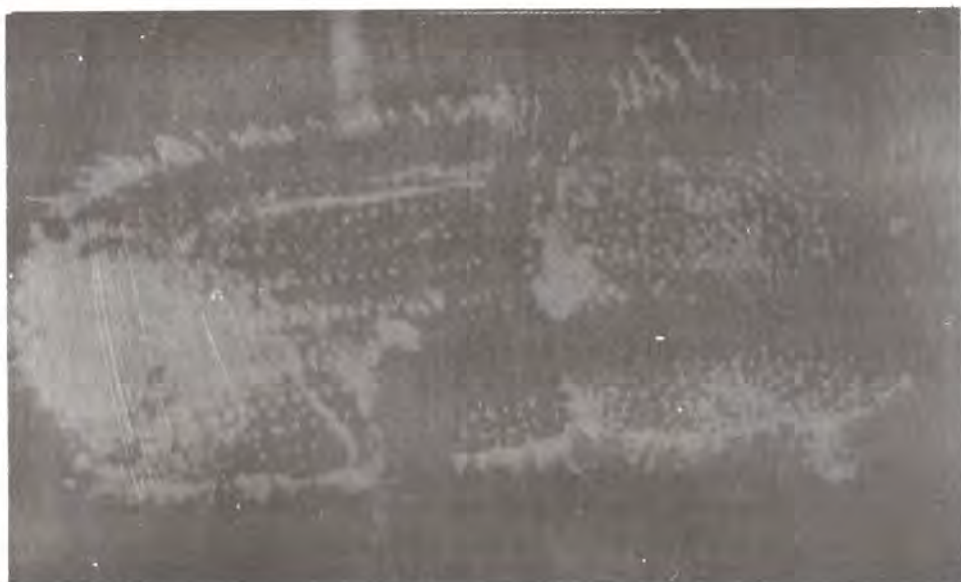
Figura 4. Ejemplar adulto de Ips pini .