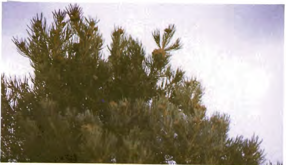
Figura 9. Cono y conillos afectados por Conophthorus adheridos al árbol.

Los adultos poseen cuerpo robusto de color cafésáceo, con escamas de color bronce; su tamaño es de 5 a 7.5 mm de longitud con un pico curvado hacia abajo. La larva es de color blanco, corta, gruesa, curvada y ápada; con cabeza café claro y las partes bucales oscuras; su longitud es de 9 mm aproximadamente.