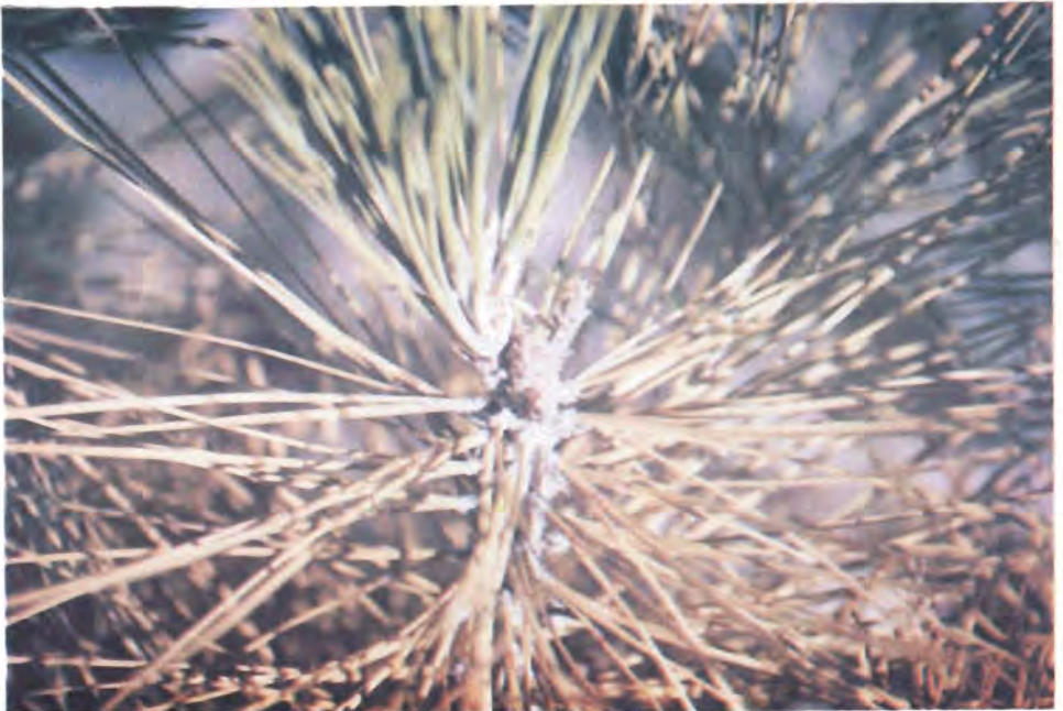
Figura 23. Puntas de crecimiento de Pinus jeffreyi muertas por barrenación interna de D. abietivorella .

Familia Iponomeutidae. Los adultos son palomillas pequeñas con alas frontales con colores brillantes. Algunas especies de esta familia actúan como minadoras de hojas, yemas y brotes.