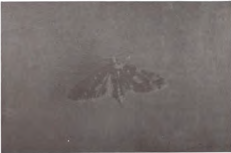
Figura 20. Adulto de Eucosma ponderosa .

Ataca conos de segundo año de desarrollo, la larva se alimenta tanto de las semillas, como de las escamas. El ataque es fácilmente observable, pues la superficie de los conos afectados presenta excremento del insecto. Por lo general, las escamas dañadas no abren en el momento de la dispersión de semillas (Figura 21); cuando esto ocurre, la larva abandona el cono y pupa en el suelo.