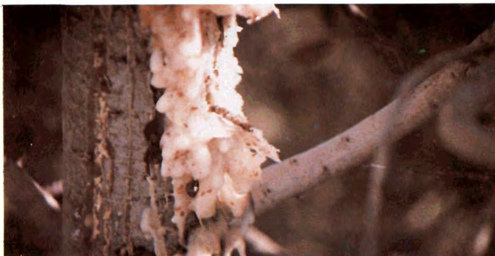
Figura 24. Larva de Vespamina sequoiae sobre el sangrado de resina que provocó al penetrar el hospedero.