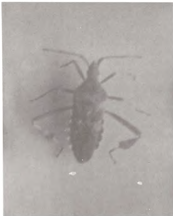
Figura 29. Adulto de Leptoglossus occidentalis .

Pinyonia edulicola y Thecodiplosis sp: Frecuentemente estos insectos son encontrados en las especies de Pinus que prosperan en el área; siendo el daño más intenso en individuos pequeños, pero en general los daños son mínimos (Figura 30).