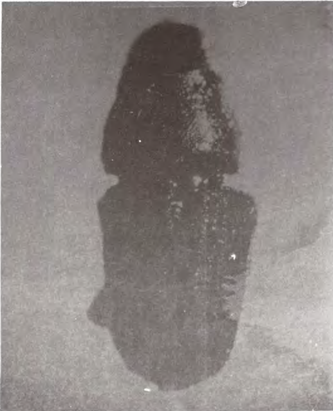
Figura 26. Adulto de Dendroctonus ponderosae .

Dendroctonus ponderosae y D. jeffreyi : Ocasionalmente llegan a atacar y eliminar individuos maduros de P. ponderosa y P. jeffreyi (Figuras 26, 27 y 28).