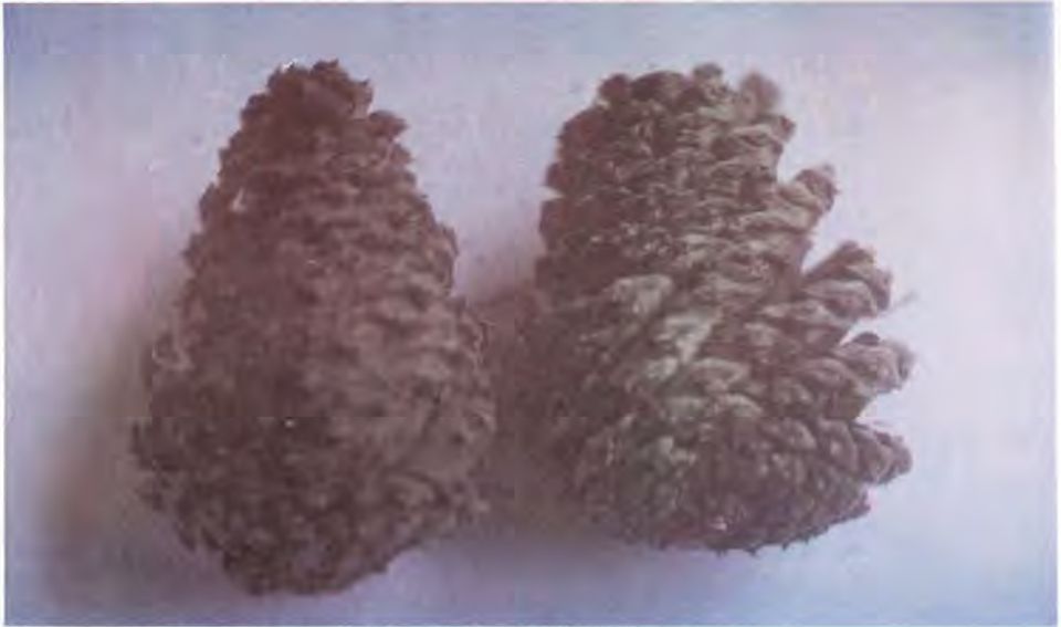
Figura 21. Conos con las escamas cerradas después de la dispersión de semillas, efecto del ataque de larvas de E. ponderosa .

Melissopus latiferreanus (Walsingham) (Lepidoptera: Olethreutidae)