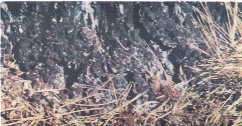
Figura 12. Grupos de resina en la base de P. quadrifolia , provocados por el ingreso de los adultos de D. valens