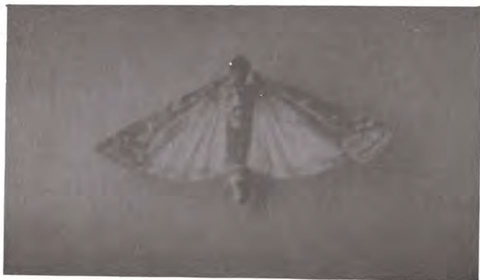
Figura 22. Adulto de Dioryctria abietivorella .

El adulto es una palomilla con alas frontales angostas con colores gris-oscuro y blanco-gris, con bandas irregulares oscuras; las alas posteriores son de color blanco-cenizo uniforme y con flecos gris-claro delimitados con el borde del ala con una línea oscura (Figura 22). La larva presenta diferentes coloraciones de cuerdo con el grado de desarrollo; en sus primeras fases es de color ámbar-ligero y al finalizar el estado es café-ambar, con una línea medio-dorsal oscura, con un par de líneas subdorsales,