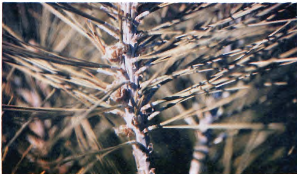
Figura 30. Rama de P. jeffreyi mostrando el efecto de Thecodiplosis sp.