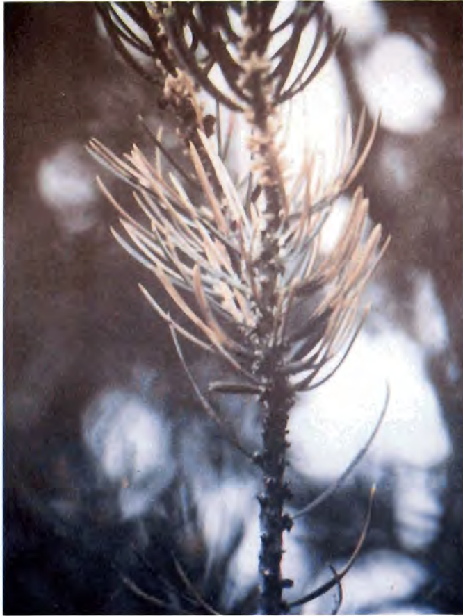
Figura 17. Ramilla de Pinus quadrifolia mostrando los efectos del ataque de las larvas de C. milleri .

larva, ocasiona los mayores daños durante la primavera y principios del verano (Figura 18). Como efecto de defoliaciones consecutivas, se observan daños que van desde la reducción del crecimiento de ramas, brotes, hojas, aborto de conillos, hasta la muerte de ramas y árboles.