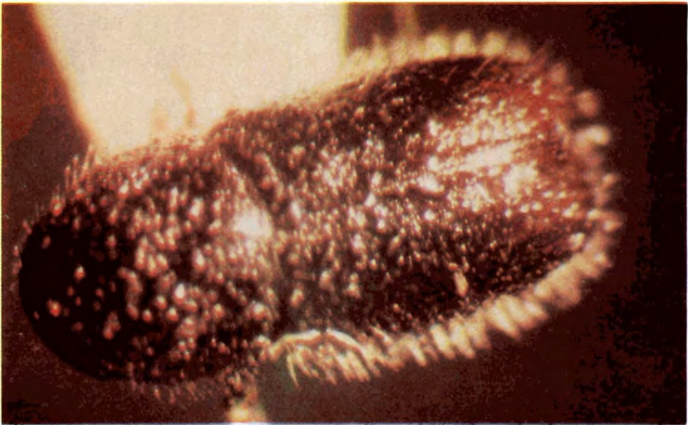
Fig. 8. Adulto de Conophorus sp.