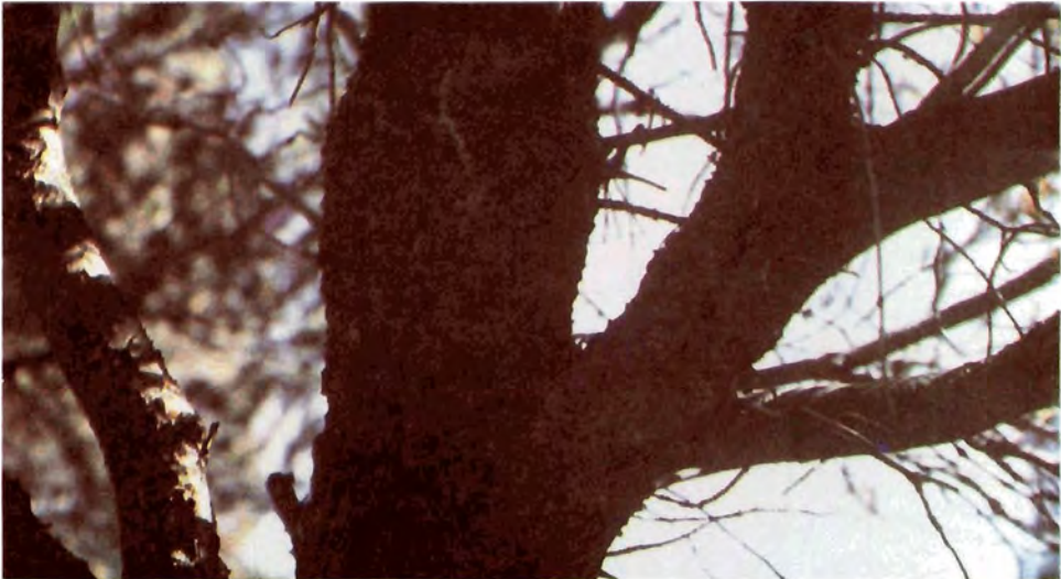
Figura 28. Pinus ponderosa mostrando los grumos dejados por D. ponderosae al ingresar.