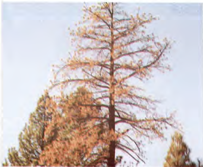
Figura 13. Individuo de P. Jeffreyi eliminado por D. valens .

Este orden incluye parásitos y depredadores de plagas, insectos polinizadores e insectos que se comportan como plagas. Presentan cuatro alas membranosas, el segundo