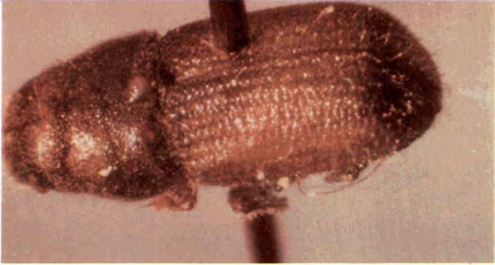
Figura 27. Adulto de D. jeffreyi .