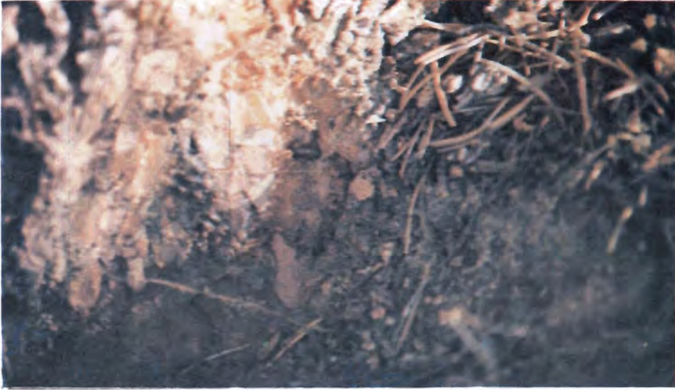
Figura 11. Adulto de D. valens penetrando a un individuo de P. jeffreyi .