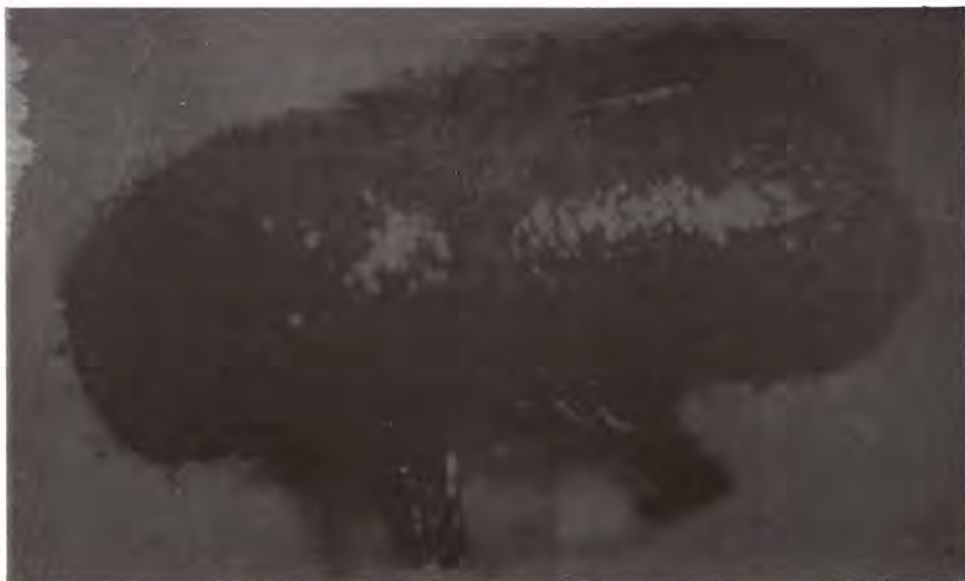
Figura 6. Adulto de Conophthorus monophyllae .

escamas y semillas destruyendo todo el interior del cono (Figura 7), pupan en el verano y en la misma estación emergen los adultos, de los cuales cierto número sale de los conos para atacar conillos y meristemos donde pasan el otoño y el invierno, y otros permanecen dentro de los conos de segundo año, lugar donde pasan estas épocas estacionales.