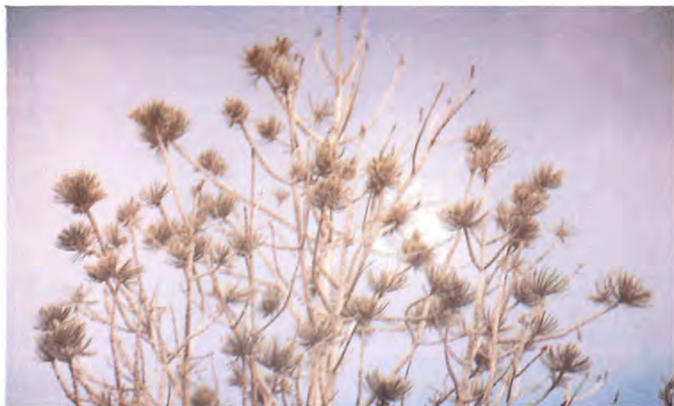
Figura 18. Pinus quadrifolia defoliado parcialmente por C. milleri .