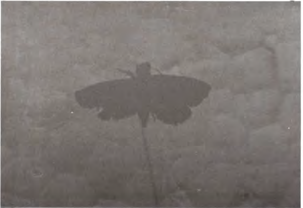
Figura 19. Adulto de Laspeyresia injectiva .

Los daños ocasionados son similares a los causados por C. miscitata , incluso atacan en forma simultánea a un mismo cono; pero una diferencia notable es que C. injectiva pupa durante el otoño y en este estado permanece hasta la siguiente primavera. Cierta número de insectos permanecen en diapausa por un año o más.